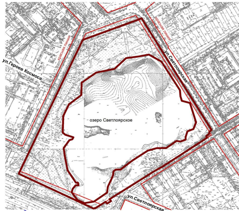
Схема границ озелененной территории общего пользования

— граница территории Площадь территории - 96 024 кв.м