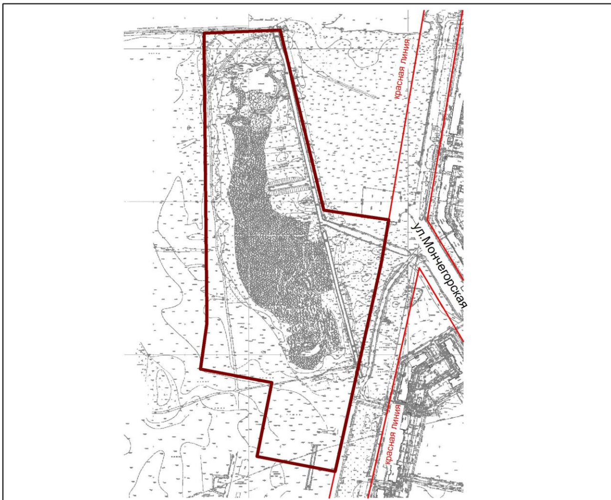
Схема границ озелененной территории общего пользования

— границы территории Площадь территории - 134 363 кв.м