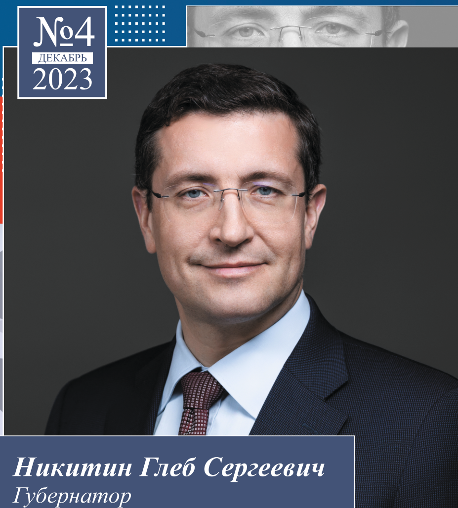
Никитин Глеб Сергеевич Губернатор Нижегородской области