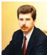
Депутат Д.П. Бирман:

- Когда рассматривается адресная инвестиционная программа, я всегда говорю о разрушающемся пристрое к школе № 47. Сейчас часть этого пристроя, который находится в аварийном состоянии, используется как ночная автостоянка – с 20 часов вечера до 8 часов утра. Ко мне пришли работники школы и родители с вопросом: можно ли направить деньги, которые платят за автостоянку, на демонтаж аварийного пристроя? Я адресовал этот вопрос в администрацию Советского района, где, к сожалению, не знают, кто на территории муниципального учреждения – школы № 47 – организовал автостоянку и куда идут средства от ее использования. Поэтому я направил запрос в администрацию города, в котором прошу дать разъяснения этой ситуации. Также я прошу взять под контроль этот вопрос при исполнении адресной инвестиционной программы, потому что, как оказалось, существуют финансовые резервы, которые неправильным образом используются.